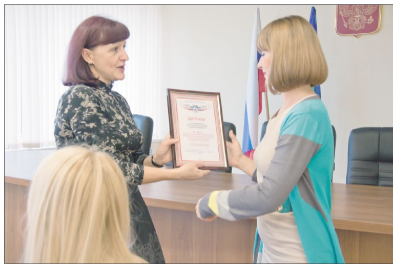
ВОРКУТИНСКИЙ ХЛЕБОКОМБИНАТ – ЛУЧШАЯ ВНЕБЮДЖЕТНАЯ ОРГАНИЗАЦИЯ

На прошлой неделе состоялось подведение итогов конкурса коллективных договоров организаций, расположенных на территории МО ГО «Воркута». Конкурс проводила муниципальная трехсторонняя комиссия по регулированию социально-трудовых отношений. Награждение победителей прошло в администрации города.