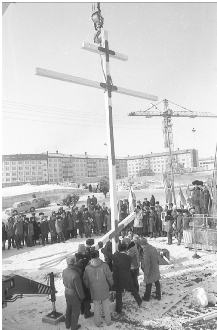
ВОЗДВИЖЕНИЕ ПАМЯТНОГО КРЕСТА НА ПРЕДПОЛАГАЕМОМ МЕСТЕ СТРОИТЕЛЬСТВА ПРАВОСЛАВНОЙ ЦЕРКВИ. «ЗАПОЛЯРЬЕ», 24 АПРЕЛЯ 1993 ГОДА

тренних дел России и по просьбе воркутинской администрации в Воркуте проводится операция «Сигнал», в которой задействованы 430 сотрудников правоохранительных органов из 13 регионов. Плотность нарядов милиции (пеших и автопатрулей) увеличилась с 35 до 131. Задержано 88 преступников, в том числе 18 криминальных группировок. Изъято большое количество оружия, боеприпасов, наркотиков (22 апреля, 19 мая).